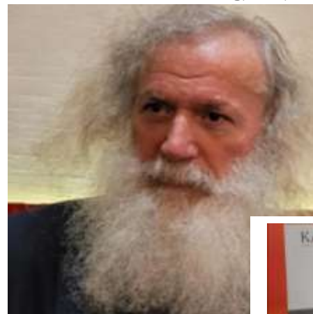
Urim Nerguti Çmimi "Përkthimi më i mirë nga frëngjishtja"